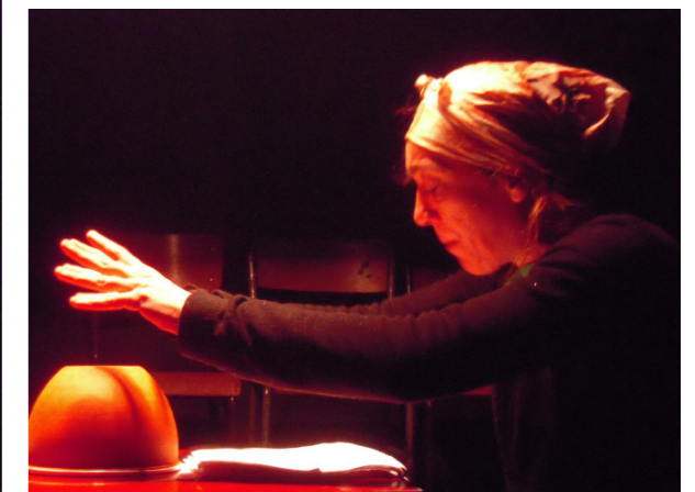
Respire! lecture à la MEO, avril 2013