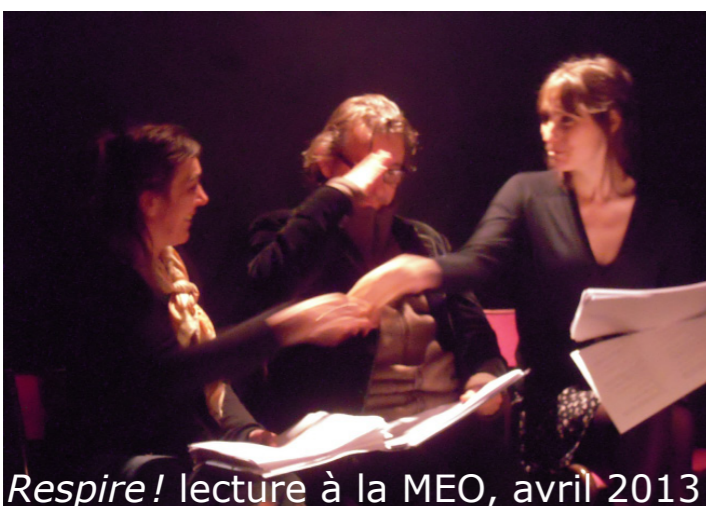
Respire! lecture à la MEO, avril 2013