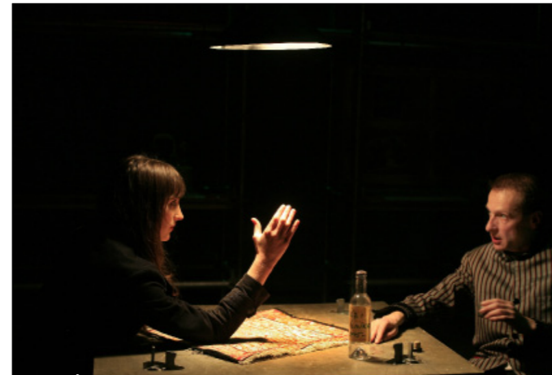
Le Démon de Debarmaalo de Goran Stefanovski

L'Histoire de ceux qui ne sont plus de Kasëm Trebeshina, création à l'ESAD Pierre Debauche à Paris, première pièce albanaise en France, 1992