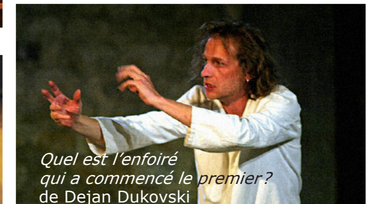
Quel est l'enfoiré qui a commencé le premier? de Dejan Dukovski