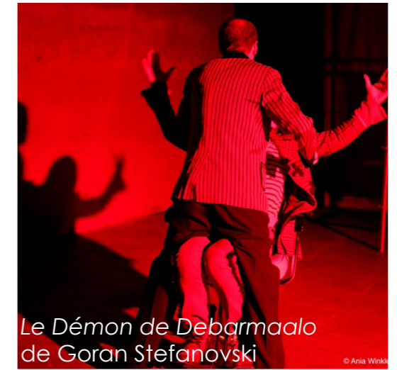
Le Démon de Debarmaalo de Goran Stefanovski