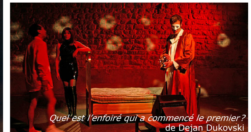
Quel est l'enfoiré qui a commencé le premier? de Dejan Dukovski